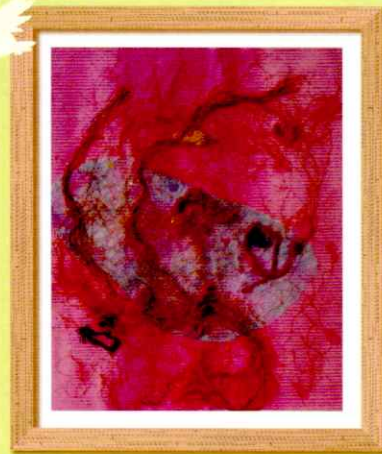
▲桜上水福祉園 石原 幸昇