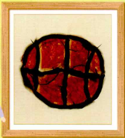
▲「母をイメージするもの～バスケットが好きだから～」 東北沢つどいの家